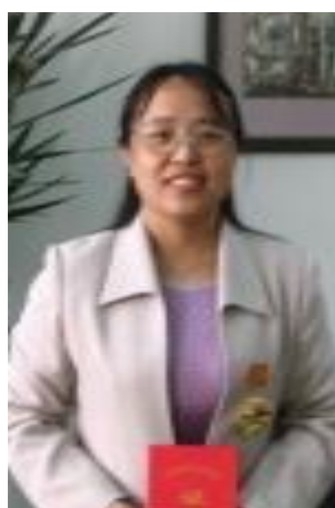
徐桂芝，教授，博导 生物医学与健康工程研究院院长，生物医学工程省级重点学科负责人、河北工业大学“元光学者”。